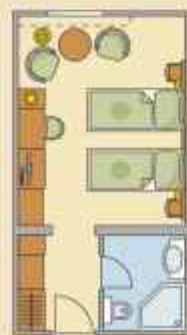
KÉTÁGYAS FŐÉPÜLETI HOTELSZOBÁK

Kényelmes, otthonosan berendezett szobák a kúria főépületében.