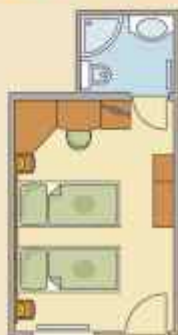
KÉTÁGYAS TORNÁCOS HOTELSZOBÁK

Ízléses, praktikus szobák a különálló tornácos épületben.