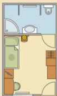
EGYÁGYAS TORNÁCOS HOTELSZOBÁK

Hangulatos, kényelmes szobák a különálló tornácos épületben.