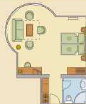
Családi Hotelszoba Nr. 107

Tágas, barátságos, kisgyermekes családok részére is ideális toronyszoba a főépületben.