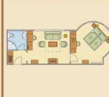
Főépületi Lakosztály Nr.108

Kétlégteres lakosztály a főépületben, amelynek a különlegessége, a kör alakú, romantikus torony hálószoba.