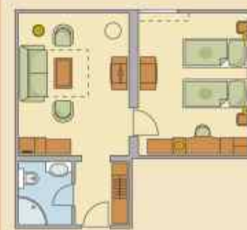
Főépületi Lakosztály Nr.102

Kétlégteres különleges lakosztály a főépületben, amely kényelmes gyermekes családok számára is.