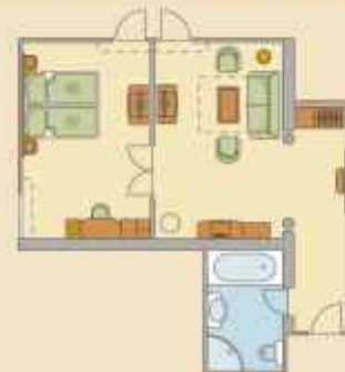
Főépületi Lakosztály Nr.101

A kúria legnagyobb és legelegánsabb, többletgyermekes főépületi lakosztálya.